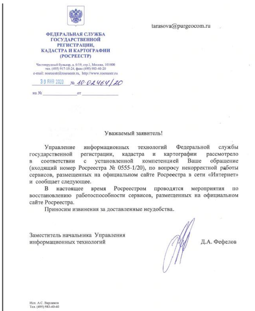
Рисунок 4 – Ответ Центрального аппарата Росреестра

31.01.2020 поступил ответ, в котором были принесены извинения и сообщалось, что проводятся мероприятия по восстановлению работоспособности сервисов, размещенных на официальном сайте Росреестра (рисунок 4).