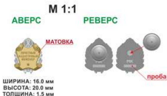
Рисунок фрачного значка к Почетному званию Ассоциации «Почетный кадастровый инженер»:

Лицевая сторона фрачного значка к Почетному званию содержит рельефное изображение: 3D (объемное изображение, несколько уровней, плавные переходы). На оборотной стороне фрачного значка к Почетному званию имеется приспособление для крепления к одежде – цанга люкс.