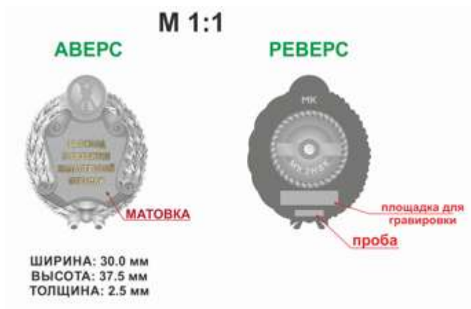
Рисунок Почетного знака Ассоциации «За вклад в развитие кадастровой отрасли»: