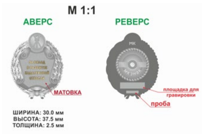
Рисунок Знака отличия Ассоциации «За вклад в развитие кадастровой отрасли»: