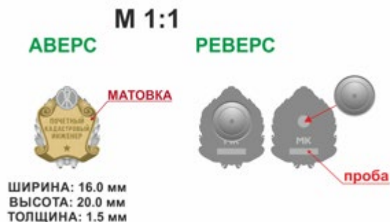
Рисунок фрачного значка к Почетному званию Ассоциации «Почетный кадастровый инженер»:

Лицевая сторона фрачного значка к Почетному званию содержит рельефное изображение: 3D (объемное изображение, несколько уровней, плавные переходы). На оборотной стороне фрачного значка к Почетному званию имеется приспособление для крепления к одежде – цанга люкс.