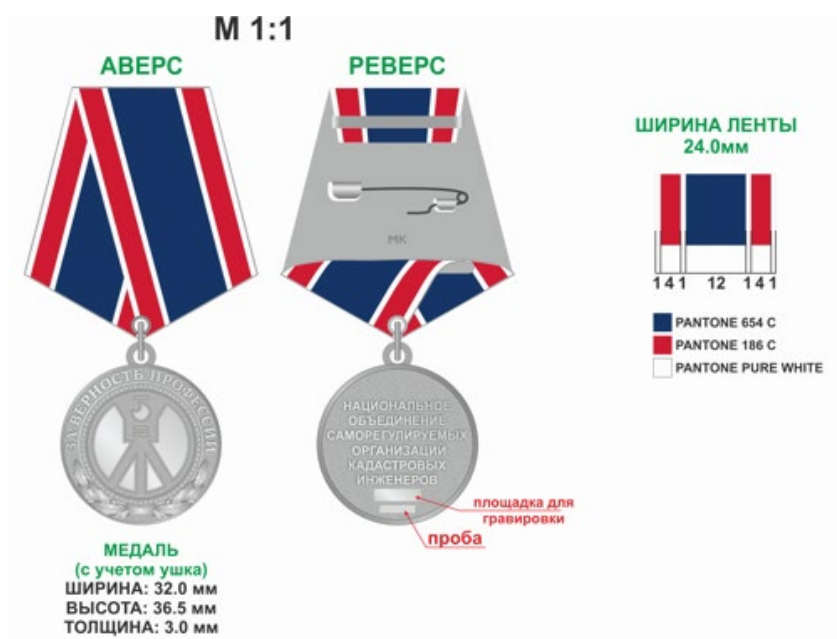
Рисунок нагрудной Медали «За верность профессии»: