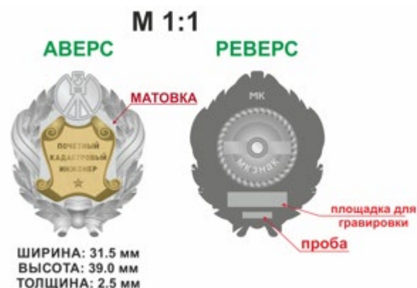
Рисунок нагрудного знака к Почетному званию Ассоциации «Почетный кадастровый инженер»:

8. Описание фрачного значка к Почетному званию Ассоциации «Почетный кадастровый инженер»: